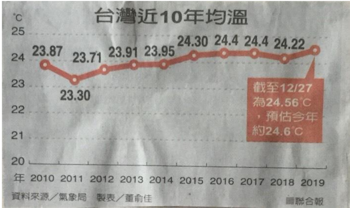
圖一 台灣近十年平均溫